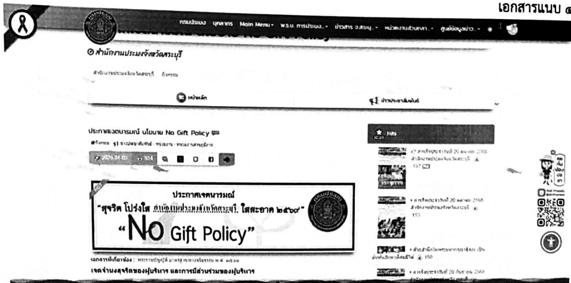
Link: ประกาศเจตนารมณ์ นโยบาย No Gift Policy บนเว็บไซต์ของสำนักงานประมงจังหวัดสระบุรี https://www4.fisheries.go.th/local/index.php/main/view_activities/๙/๙๖๑๑๑๑