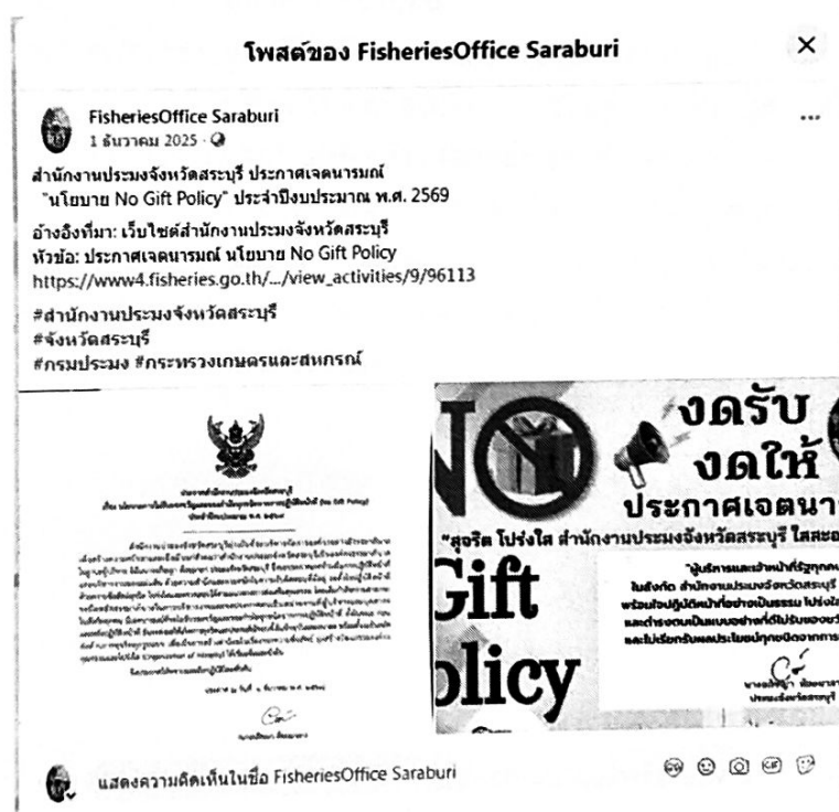
Link: ประกาศเจตนารมณ์ นโยบาย No Gift Policy บน Facebook ของสำนักงานประมงจังหวัดสระบุรี https://www.facebook.com/share/p/๑CyrB๘swFr/