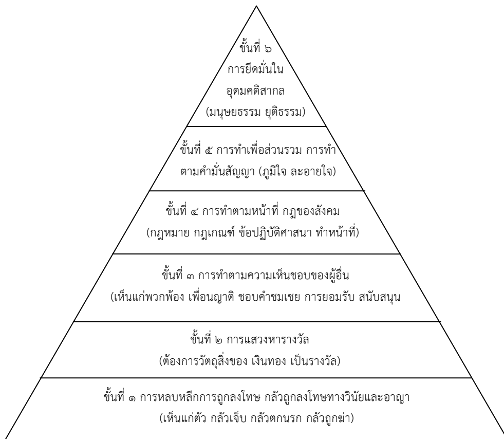
โครงสร้างทางจิต ๖ ชั้น ของจริยธรรมในมนุษย์

หลักการที่มนุษย์ใช้ในการตัดสินใจที่จะกระทำหรือไม่กระทำสิ่งใดนั้นมีอยู่ ๖ ชั้น ตามทฤษฎีของโคลเบอร์ก ซึ่งสอดคล้องกับทฤษฎีของดวงเดือน พันธุมนาวิน และหลักศาสนา เราใช้หลักการและเหตุผล ๖ ชั้นของการพัฒนาต่อไปนี้ในการตัดสินใจ เปรียบเสมือนเข็มทิศหรือทางเสือ นำทางให้เรากระทำหรือไม่กระทำสิ่งใด