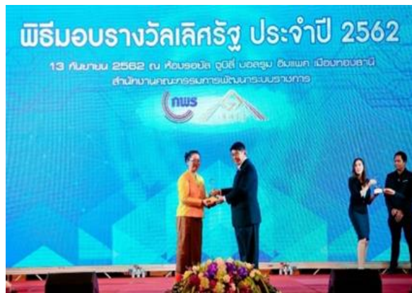
3. รางวัลเลิศรัฐประจำปี พ.ศ. 2562 สาขาการบริหารราชการแบบมีส่วนร่วม ประเภทรางวัลสัมฤทธิ์ผลประชาชนมีส่วนร่วม (Change) “ระดับดี” โครงการธนาคารผลผลิตเกษตรกรด้านการประมงหนองคู จังหวัดนครราชสีมา