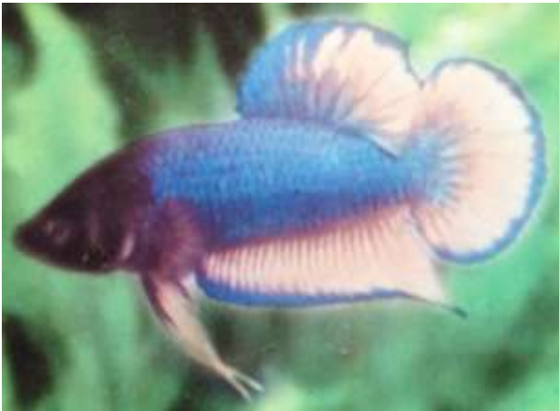
ปลากัดครีบทองหางเดี่ยว