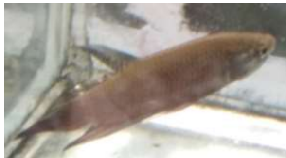
ปลากัดป่าสายดั้งเดิม