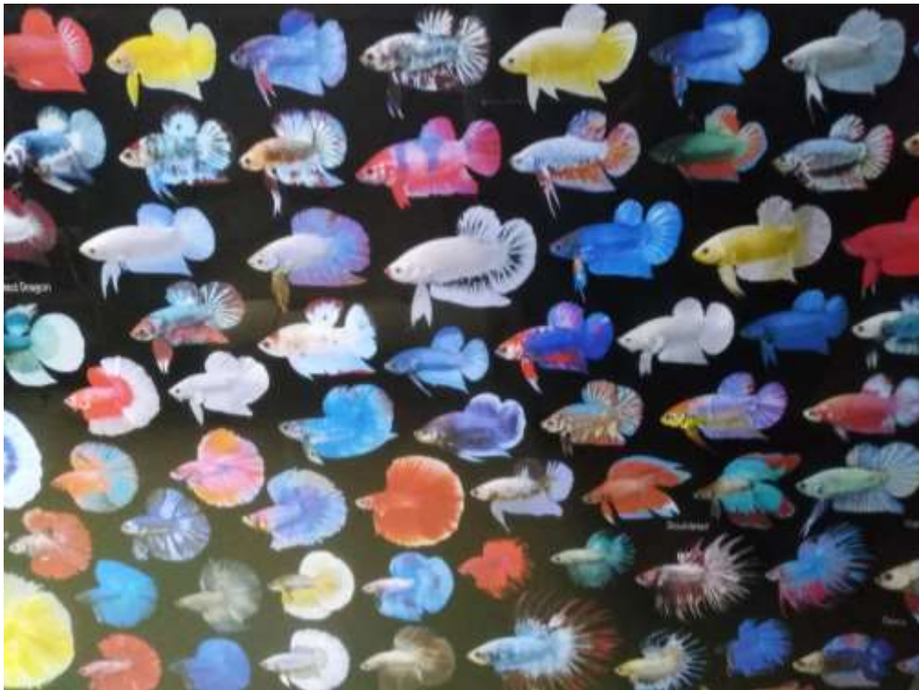
ความหลากหลายของสายพันธุ์ปลากัด ( Betta splendens Regan, 1910)

หมายถึง ปลากัดที่มีรูปแบบ แถบสีและลวดลาย ที่หลากหลายซึ่งต้องมีตั้งแต่ 2 สีขึ้นไป โดยปลากัดลวดลายสามารถแบ่งออกได้เป็น หินอ่อน ลายจุด และลายหัว