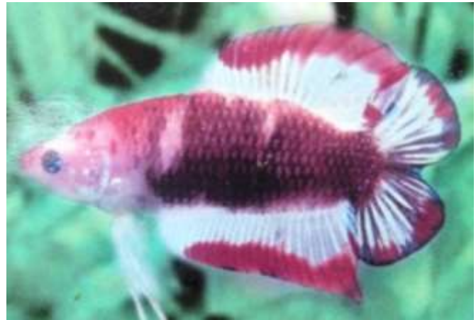
ปลากัดครีบทองหางคู่