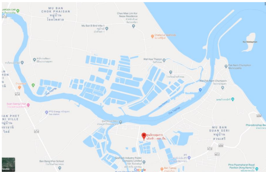
ภาพที่ ๒ ที่ตั้ง ศูนย์ควบคุมการแจ้งเข้า-ออกเรือประมงชุมพร