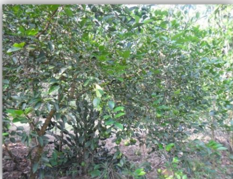
แปลงมะนาว