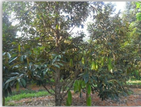
แปลงทุเรียน