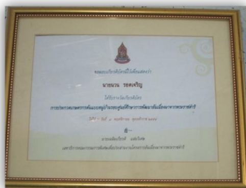
ใบเกียรติบัตรการประกวดเกษตรกรต้นแบบหมู่บ้าน รอบศูนย์ศึกษาอันเนื่องมาจากพระราชดำริ