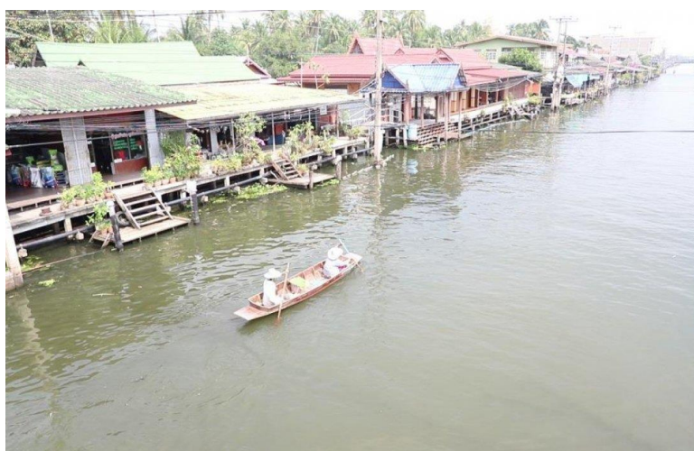
คลองดำเนินสะดวก อ.ดำเนินสะดวก จ.ราชบุรี