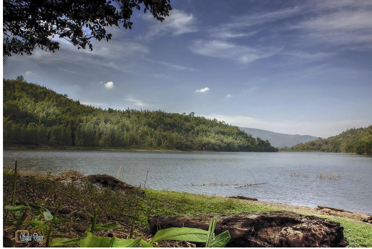
อ่างเก็บน้ำห้วยอะนะ ต.ตะนาวสี อ.สวนผึ้ง จ.ราชบุรี