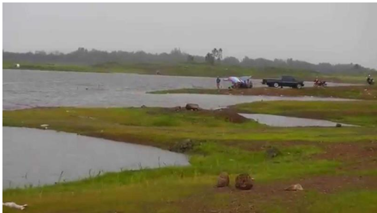
อ่างเก็บน้ำห้วยสำนักไม้เต็ง ต.น้ำพุ อ.เมืองราชบุรี จ.ราชบุรี

แหล่งน้ำปิดในจังหวัดราชบุรี เป็นอ่างเก็บน้ำ ซึ่งส่วนใหญ่อยู่ในพื้นที่อำเภอเมืองราชบุรี อำเภอสวนผึ้ง อำเภอบ้านคา อำเภอปากท่อ นอกจากนี้ยังมีบึงธรรมชาติอีกด้วย รวมจำนวนแหล่งน้ำปิดทั้งหมด ๖๑ แห่ง พื้นที่รวมทั้งสิ้น ๑๓,๔๓๐.๗๒ ไร่