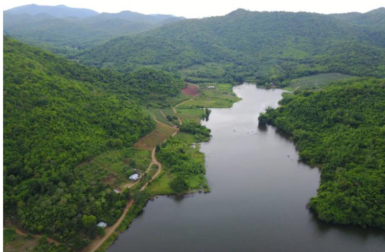
อ่างเก็บน้ำบ้านพุกруд ต.ยางหัก อ.ปากท่อ จ.ราชบุรี