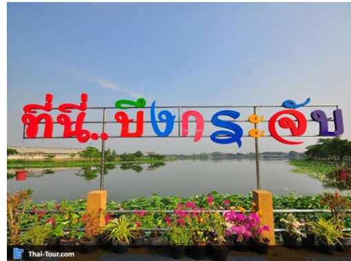
บึงกระจัด ต.หนองกบ อ.บ้านโป่ง จ.ราชบุรี