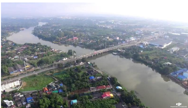
สะพานสิริลักษณ์ข้ามแม่น้ำแม่กลอง ตัวเมืองราชบุรี

แหล่งน้ำจัดของจังหวัดราชบุรี ทั้ง ๑๐ อำเภอ มีจำนวน ๑๙๓ แหล่ง พื้นที่รวมทั้งสิ้น ๑๙,๗๓๓.๗๘ ไร่