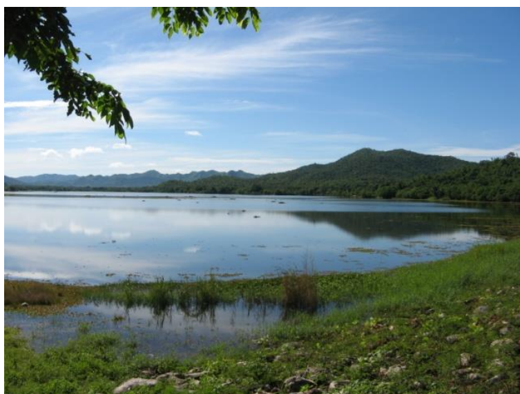
อ่างเก็บน้ำห้วยมะหาด ต.หนองพันจันทร์ อ.บ้านคา จ.ราชบุรี