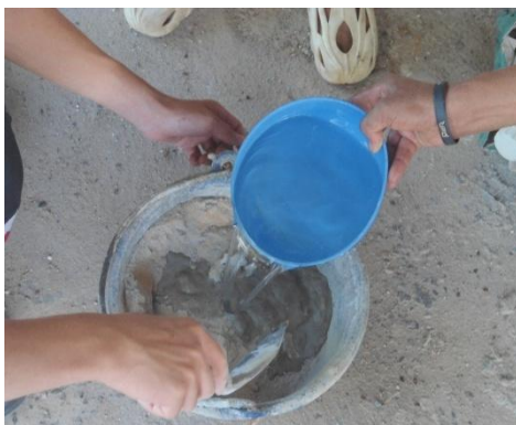
ภาพการผสมปูน