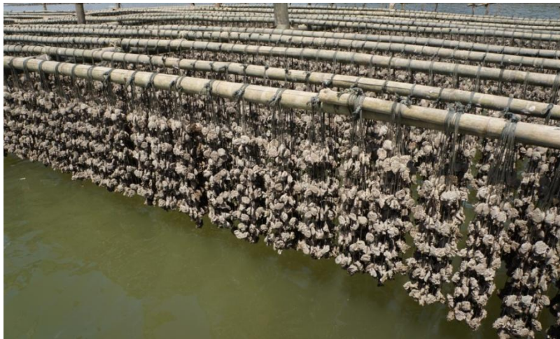
ภาพนำแป้นหอยไปเพาะพันธุ์เชื้อหอย