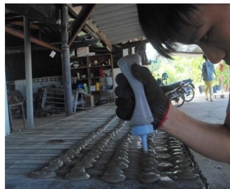
ภาพแสดงการหยอดแป้นหอย