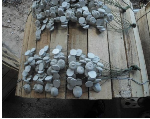
ภาพเก็บแป้นหอยเป็นพวง