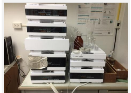
ภาพแสดงขั้นตอนกระบวนการวิเคราะห์สารตกค้างเพื่อ ตรวจสอบความใช้ได้ของวิธีการทดสอบ(Method validation) และหาค่าความไม่แน่นอนของผลการทดสอบ(Uncertainty)