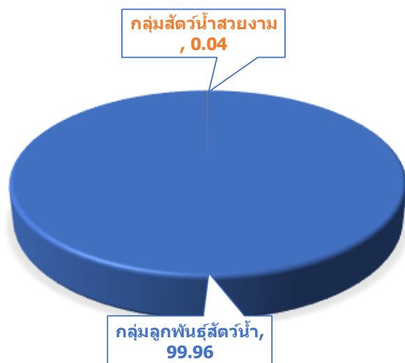
สัดส่วนปริมาณสินค้าสัตว์น้ำส่งออกกลุ่มที่มีหน่วยนับเป็นตัว

การส่งออกสินค้าสัตว์น้ำผ่านทางด่านตรวจสัตว์น้ำจังหวัดอุบลราชธานี ประจำเดือน กุมภาพันธ์ 2561 มีมูลค่าการส่งออกทั้งสิ้น 6,097,863 บาท เทียบกับเดือนกุมภาพันธ์ 2560 มูลค่าลดลงร้อยละ 23.40 โดยมีมูลค่าการส่งออกสินค้าสัตว์น้ำกลุ่มต่างๆ ดังนี้ กลุ่มลูกพันธุ์สัตว์น้ำ มีมูลค่า 1,310,000 บาท เพิ่มขึ้นร้อยละ 140.37 กลุ่มสัตว์น้ำสวยงามมีมูลค่า 16,740 บาท กลุ่มมีชีวิตเพื่อการบริโภค มีมูลค่า 1,372,550 บาท ลดลงร้อยละ 59.54 กลุ่มแช่แข็ง มีมูลค่า 2,628,463 บาท เพิ่มขึ้นร้อยละ 3.98 กลุ่มแช่เย็น มีมูลค่า 770,110 บาท ลดลงร้อยละ 47.34