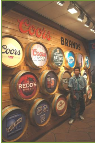
โรงงานเบียร์ Coors

วันที่ ๔ เดือนตุลาคมเป็นช่วงฤดูใบไม้ร่วง ตำบล