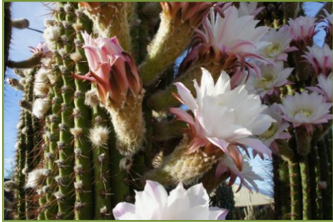
ต้นตะบองเพชรในร้านขายต้นไม้ เขียนคำเชิญชวนลูกค้า Save the water buy cactus

ในครัวกลางบ้าน ฝรั่งเศสจามกันน้ำหูน้าตาไหล ต้องรีบเปิดหน้าต่างเป่าพัดลมกันวุ่นวาย ฝรั่งเศสยังโวยวายอีก พวกคุณทำอะไรกัน My house small fishy ฝรั่งเศสไม่คุ้นกับกลิ่นน้ำปลา พริกชี้ฟ้าเผ็ดมาก คาดเตาเอาเองว่าผู้อพยพน่าจะนำเมล็ดพันธุ์ไปจากแถวบ้านเรา ฝรั่งเศสก็คุยเกทับว่า อเมริกาสามารถผสมพันธุ์พริกได้เผ็ดเป็นลำดับที่ ๑ ของโลก แต่ไม่เป็นที่นิยมกันเพราะเผ็ดเกินไป