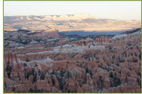
Sunset view point อุทยานแห่งชาติ Bryce

สภาวะแวดล้อมที่ทุรกันดารที่สุดเกินกว่ามนุษย์จะทนทานได้ทุกแห่งในโลกนี้ มักจะมีสิ่งมีชีวิตครอบครองเป็นเจ้าของพื้นที่อยู่เสมอ ใครปรับตัวอยู่ได้ในสภาวะแวดล้อมโหดยิ่งยวดมากเท่าใดศัตรูคู่แข่งยิ่งน้อยเท่านั้น อาร์ทีเมีย (Artemia) เจ้าแพลงก์ตอนสัตว์ตัวเล็ก กระจิวหิว นุ่มนิ่ม ไม่มีเขี้ยวเล็บและพิษสงใดๆ จึงแพร่พันธุ์ครอบครองพื้นที่ Grate Salt Lake ปริมาณมากมายมหาศาล คนอเมริกันเก็บเกี่ยวไซ (Cyst) อาร์ทีเมียส่งจำหน่ายไปทั่วโลกมูลค่าปีละหลายพันล้านดอลลาร์ ความจำกัดของปริมาณน้ำใช้ในกิจกรรมการดำเนินชีวิตทำให้พืชพรรณไม้ในพื้นที่กึ่งทะเลทรายเติบโตช้ามาก เมื่อฝนตกจึงเกิดการกัดเซาะอย่างรุนแรง เกิดเป็นโหดเขาหินผารูปทรงแปลกตาให้เที่ยวชม