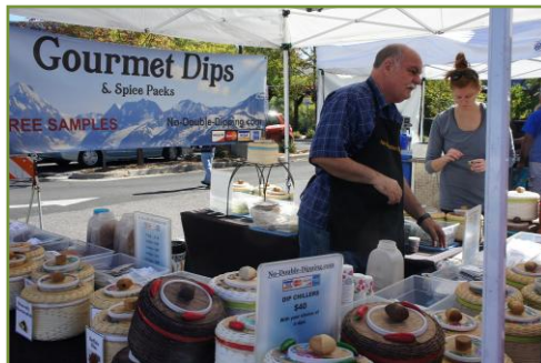
บรรยากาศ Farmer market ตลาดนัดสไตล์อเมริกันลูกทุ่งที่เกษตรกรนำผักผลไม้และผลผลิตมาจำหน่ายโดยตรง มักจัดเดือนละครั้ง สองครั้งในฤดูร้อนและฤดูใบไม้ร่วง