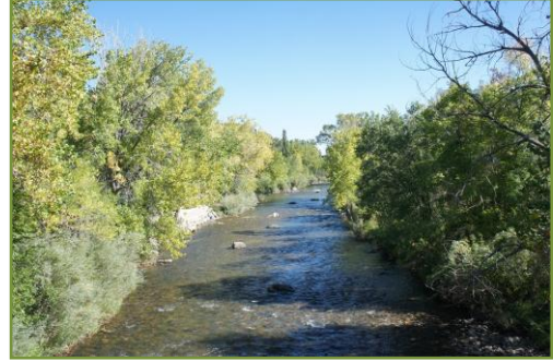
ลำธารน้ำช่วงที่ไหลผ่านเมือง Golden

เพราะเกี่ยวเนื่องกับชีวิตของพืชสัตว์มนุษย์ทุกต้นทุกตัวและทุกคน เกิดประเด็นให้ กังขา เพราะเราเคยแต่ดูภาพยนตร์ Cowboy พระเอกมาดเท่ห์ พกปืนสั้นปืนยาวขี่ ม้าบุกตะลุย Wild West ผจญเหล่าร้ายและอินเดียนแดง ผ่านทุ่งหญ้าแห้งแล้งสุด ลูกหูลูกตาที่มีต้นตะบองเพชรต้นใหญ่กว่าคน แต่มาวันนี้ฝรั่งบอกเราว่าฝนตกมาก