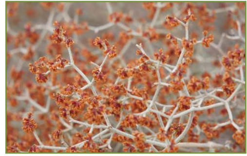
กอไม้ขนาดเล็กหน้าตาคล้ายพญาไร้ใบ ข้างทางแถบรัฐ Arizona