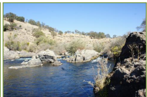
พืชน้ำ ดอกหญาภิรมตลิ่ง สาหร่าย และกุ้ง Craw fish ในลำธารเมือง Oakdale รัฐ California