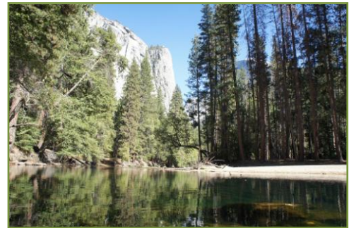
อุทยานแห่งชาติ Yosemite

เมือง Oakdale มีสวนไม้ผลตลอดสองข้างทาง แอปเปิ้ล พรุณ วอลนัท สตรอเบอร์รี่ องุ่นแบล็คเบอร์รี่ ๗ ชนิด รถนานับชั่วโมงก็ยังไม่ตลอดพื้นที่เพาะปลูก ชาวเมืองและชาวเวียดนามผู้อพยพมาปลูกพริก หอม ขิง ข่า ตะไคร้ ๗ ขายเป็นอยู่ข้างทาง คนลาวเปิดร้านขายของชำมีปลา ร้า กระเพรา โหระพา กระเทียม มะนาว ข้าวเหนียว ข้าวเจ้า ครบครัน เราจึงได้รับประทานต้มยำกุ้งเต็มสูตรด้วยฝีมือของเราเอง ที่นี่บ้านเมืองหนา เขาปิดสนิท ต้มยำทำแกง