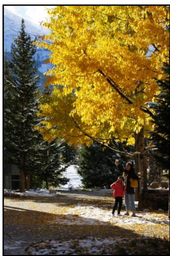
สีส้มของฤดูใบไม้ร่วง

เพื่อผ่อนคลายความเหนื่อยล้าจากภาระงานประจำ เรียกความสดชื่นแจ่มใสกลับคืนมา หลังจากสิ้นสุดปีงบประมาณ ๒๕๕๗ ที่สุดแสนจะยุ่งเหยิง เนื่องจากปีที่ผ่านมาประเทศไทยทำให้ทั่วโลกปั่นป่วน ด้วยโรค EMS ทำให้ผลผลิตกุ้ง ๖ แสนกว่าตัน ลดลงเหลือไม่ถึง ๒ แสนตัน ฟาร์มเพาะเลี้ยงกุ้งอุตสาหกรรมอาหารแช่แข็ง โรงงานอาหารสัตว์ และแรงงาน เจ็งกันระนาวกราวรูต คสช. จึงอนุมัติให้กรมประมงใช้งบกลางของประเศมาแก้ไขปัญหาโรคระบาดกุ้งขาวแอฟริกาที่สำคัญคืออนุมัติตอนปลายปีเหลือเวลาทำงานเพียงเดือนครึ่ง จำละหวั่นปั่นป่วนกันไปทั้งกรม ทั้งนี้ผลผลิตกุ้งโดยรวมของ