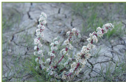
ดอกไม้กลีบแข็งขนาดเล็ก ข้างทางแถบรัฐ Utah ร่องรอยของดินแตกระแหงหลังฝนตก

ดึงดูดผู้คนให้เข้ามาใช้พื้นที่ให้เกิดประโยชน์ เนื่องจากพื้นที่ใช้ทำอะไรก็ไม่ได้ ปริมาณน้ำฝนเฉลี่ยต่อปีเพียง ๔.๑๙ นิ้ว หิมะตกเพียงปีละ ๐.๓ นิ้ว เมื่อเข้าเขตรัฐ California แรกๆ ก็