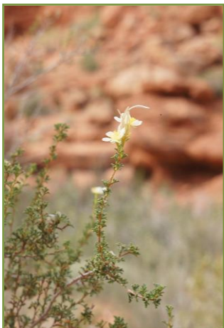
ดอกไม้ในหุบเขา Canyon อุทยานแห่งชาติ Zion

การเดินทางครั้งนี้ไม่ได้ขึ้นสูงไปถึง Grate salt lake หรือ Grand Canyon ผ่านเขตพื้นที่ตอนใต้ของรัฐ Utah และรัฐ Arizona แล้วเข้าสู่เขตรัฐ Nevada สองข้างทางแทบจะไร้ร่องรอยของผู้อยู่อาศัย มีที่พักรถเป็นระยะๆ ภูมิทัศน์เป็นเขาสูง หุบเขากว้าง โตรกลึก แต่ก็พอมองเห็นว่ามึร่องรอยของน้ำกัดเซาะเป็นทางน้ำไหลผ่าน กวาดสายตาไปรอบสองข้างทางมีแต่หินกับต้นตะบองเพชร ทว่าเมื่อตั้งใจมองหา ก็พบว่า มีดอกไม้เล็กๆ เบ่งบานอยู่ในระบบนิเวศที่แห้งแล้งนี้ หลายชนิด มีอยู่กอหนึ่งน่าสนใจมาก ไม่มีใบเลย กิ่งต่อกันไปเป็นข้อเป็นปล้องเป็นโครงตาข่าย แทบทุกข้อมีดอกสีส้มสดใส คิดเอาเองว่าเราช่างเป็นคนโชคที่โชคดีเสียยิ่งกระไร จะมีใครสักกี่คนในโลกที่ได้เห็น