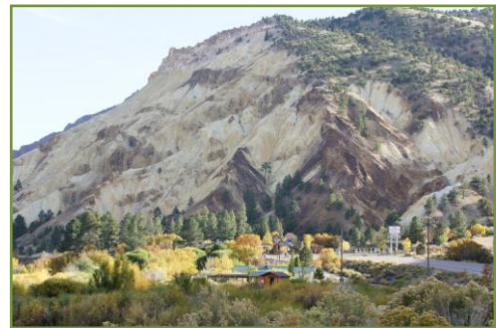
สีสันของเมือง Candy Mountain รัฐ Utah มีกิจกรรมท่องเที่ยวขี่จักรยานภูเขา ล่องแก่ง แคมป์ รถ ATV ซี่ม้า ตกปลา

สัปดาห์ต่อมาเดินทางไปทางตะวันตกลัดเลาะตาม แม่น้ำโคโลราโดไปเรื่อยๆ พื้นที่สองข้างทางเห็นแต่ทุ่งหญ้าแห้งๆ อาจเนื่องจากเป็นช่วงฤดูใบไม้ร่วง ภูเขาหัวโล้นมีต้นสนประปราย และมีการเลี้ยงวัวกันมากแถบนี้ เมื่อเริ่มข้ามเทือกเขา Rocky ความ แห้งแล้งก็ปรากฏแก่สายตามากขึ้นเป็นลำดับ ผ่านเข้าสู่เขตรัฐ Utah ซึ่งเป็นที่ตั้งของทะเลสาบน้ำเค็ม Grate salt lake ข้อมูล บอกว่าเมืองนี้มีฝนตกเฉลี่ยเพียงปีละ ๑๕.๗ นิ้ว ปริมาณหิมะไม่ แน่นนอนเนื่องจากความร้อนแฝงที่สะสมในน้ำที่มีเกลือละลายอยู่มาก จึงอาจมีหิมะตกได้ตั้งแต่ปีละ ๑๕ - ๕๐ กว่านิ้ว เราจะพบว่าใน