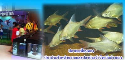
ปลาคะป๋วยทอง ปลาประจำหน่วยงานและปลาประจำจังหวัดอ่างทอง