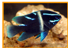
ลูกปลาวัยรุ่น

ศูนย์วิจัยและพัฒนาประมงชายฝั่งสมุทรศาสตร์เพาะพันธุ์ปลาสลิดหินนีออน blue velvet damsel ( Neoglyphidodon oxyodon ) สำเร็จเป็นครั้งแรกในเดือนมีนาคม 2549 และสามารถเพาะพันธุ์ปลาสลิดหินสกุล Chrysiptera สายพันธุ์ต่างประเทศได้ในปี 2551 สลิดหินทางเหลือง และสลิดหินทางขาว