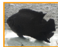
พ่อแม่พันธุ์