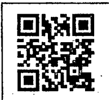
(พิมพ์เอกสารแนบ สิ่งที่ส่งมาด้วย ๑)