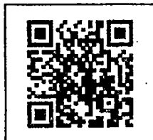
(แนบสำรวจออนไลน์) สิ่งที่ส่งมาด้วย ๒