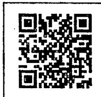
(แนบสำรวจออนไลน์) สิ่งที่ส่งมาด้วย ๓